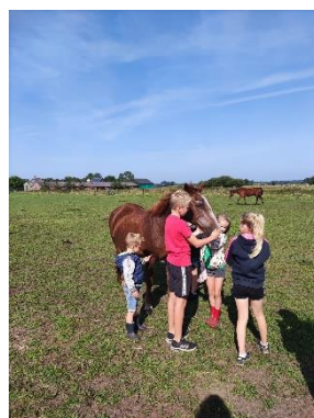
Foto van de paardensafari op 5 september.

5 september was er weer de eerste kijk en doedag.